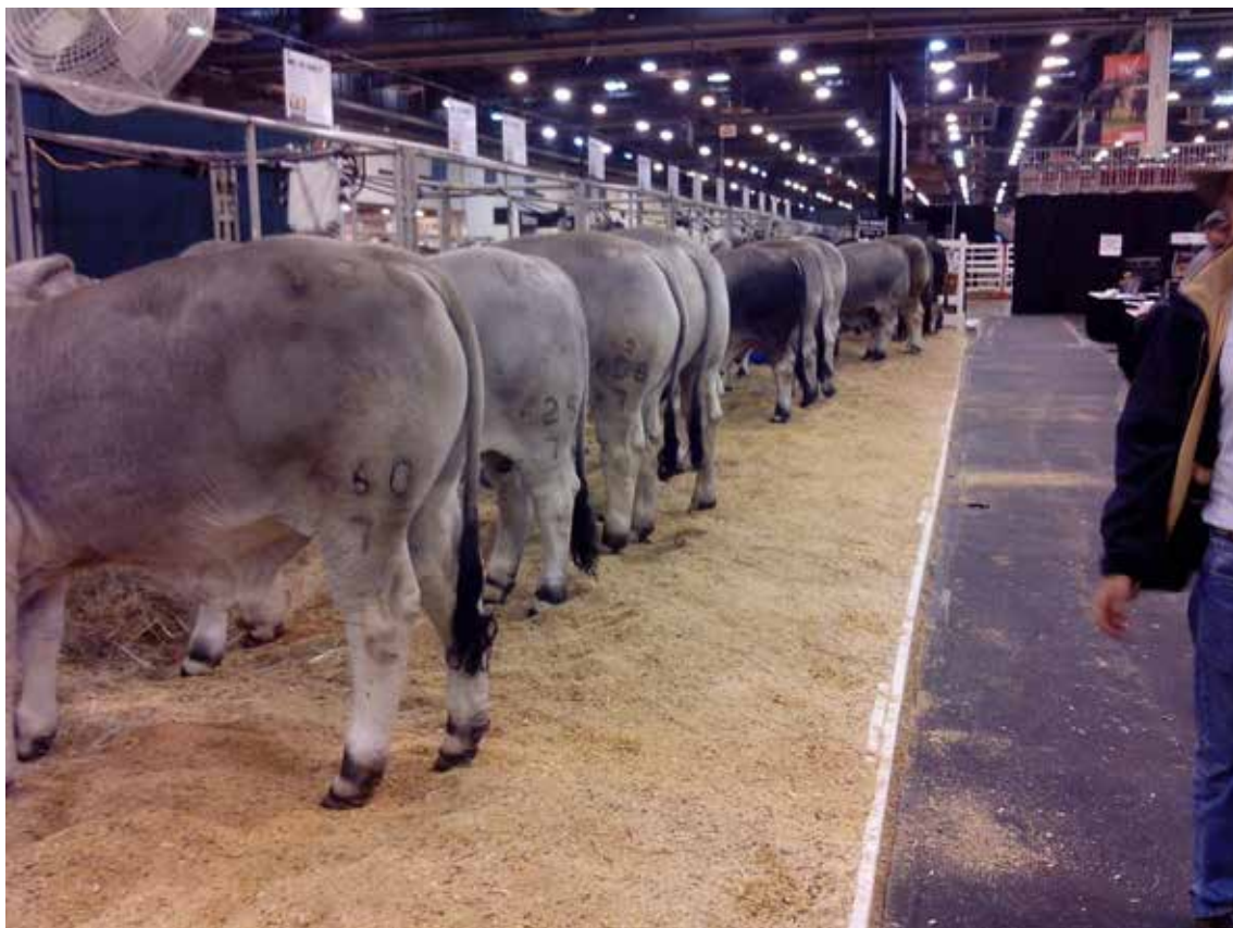
Foto 7. Grupo de ejemplares participantes en la Feria de Houston - Texas, 2015 instalados en un pabellón que se destaca por su buena presentación, buen aserrín en las camas para comodidad de los ejemplares y buena limpieza en los pisos.