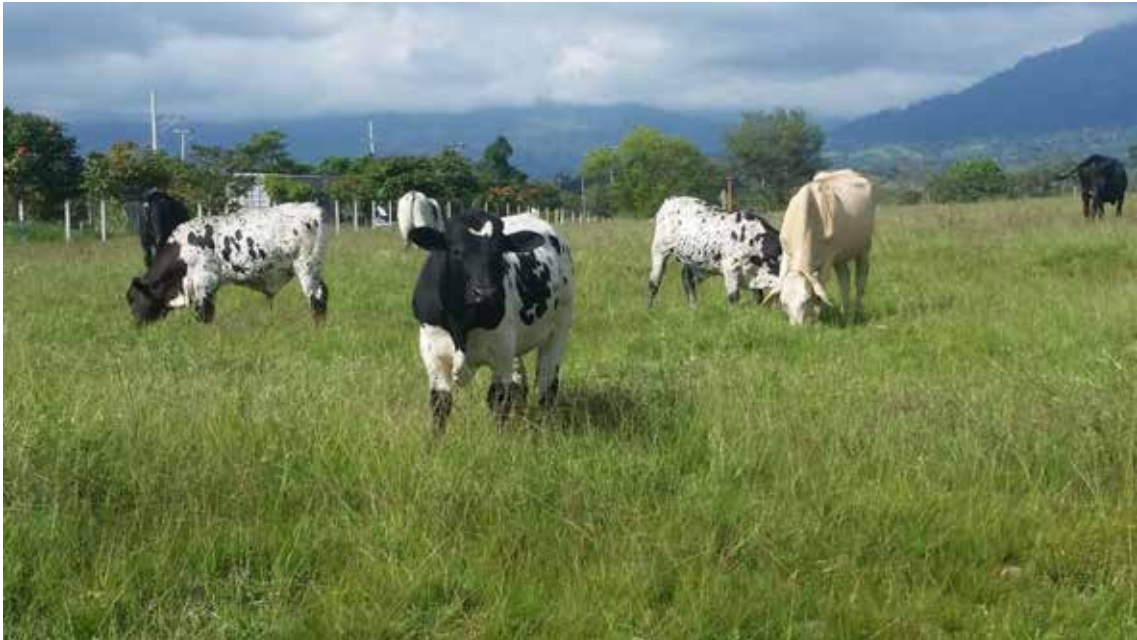
Foto 4. El mejor negocio en ganado comercial es poder vender directo a sacrificio el ternero destete producto de vacas de buena habilidad materna.

Foto 2. La producción de buenas crías es una de las características más altas para que una vaca con 5-6 partos permanezca en un hato.