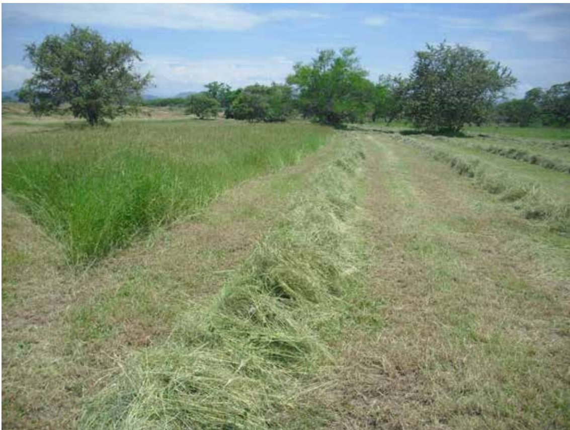
Foto 1. Los forrajes son en general la fuente más económica de nutrientes para el ganado.

Las cifras en Australia son claras, cuando se programa con dos años de anterioridad la compra de comida, los precios de suplemento resultan ser la mitad que cuando se pretende comprar la comida en el mismo momento del verano; igual pasa en Colombia, si el heno se compra en época de lluvias y se almacena con anterioridad al verano, el precio de compra es bajo comparado con precio al final de la época de sequía; así mismo, para conservar buena condición corporal de la vacada hay que suministrar el heno desde el comienzo de la época seca, contrario a si se suministra el forraje al final de la sequía cuando ya ha perdido su condición corporal.