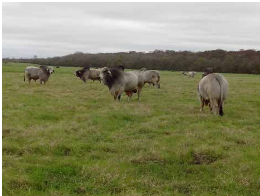
Foto 8. La calidad del reproductor ha sido factor de éxito en la ganadería de Don Julio Rebolledo.

Foto 5. Muchos años de trabajo se requieren para tener un lote de toros de alta calidad.